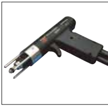
Standardschweißpistole PS-1 PS-1 standard welding gun