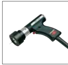
Schweißpistole PS-1KI zum Aufschweißen von Tellerstiften auf metallische Werkstücke PS-1KI welding gun for welding cupped head pins onto metallic workpieces