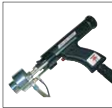
Schweißpistole PH-3N SRM zum Muttern- und Bolzenschweißen mit magnetisch bewegtem Lichtbogen PH-3N SRM welding gun for nut and stud welding using a magnetically moved arc