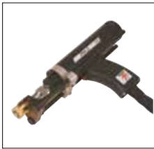
Standardschweißpistole PH-2 PH-2 standard welding gun