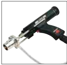
Standardschweißpistole PH-3N PH-3N standard welding gun