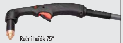
Ruční hořák 75°

(více volitelných možností hořáku viz www.hypertherm.com )