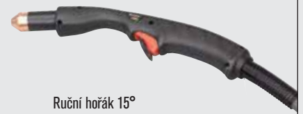
Ruční hořák 15°