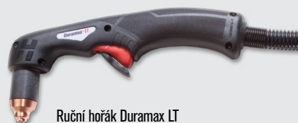
Ruční hořák Duramax LT