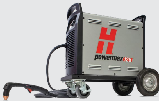
Sada na kolech