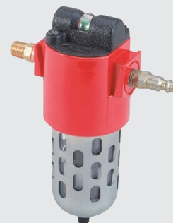
Sada pro filtrování vzduchu