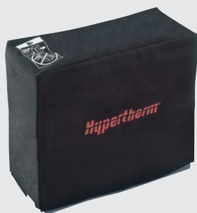
Systémový ochranný obal proti prachu