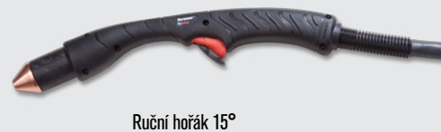
Ruční hořák 15°