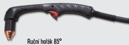
Ruční hořák 85°

(více volitelných možností hořáku viz www.hypertherm.com )