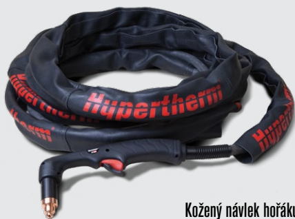
Kožený návlek hořáku