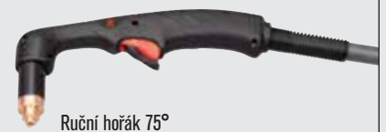
Ruční hořák 75°

(více volitelných možností hořáku viz www.hypertherm.com )